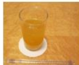
⑥オレンジジュース