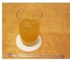
⑥オレンジジュース