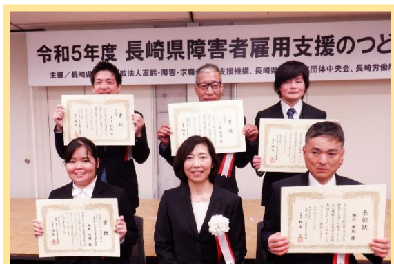
表彰式の最後に表彰された方々と記念撮影を行いました。受賞された皆様おめでとうございます。