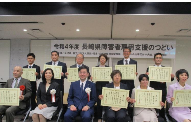
表彰式の最後に表彰された方々と記念 撮影を行いました。 受賞された皆様おめでとございます。