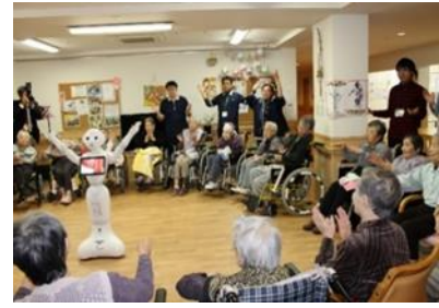
パルロ体操(集団レクリエーション)