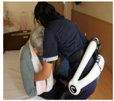
介護支援用ロボットスーツ HAL(ハル) 腰負担軽減に効果大