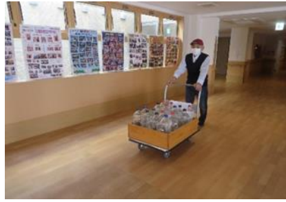
高年齢者短時間職員にお願いしている水運び作業