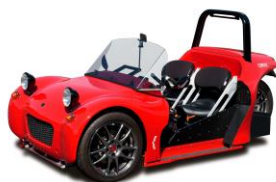
コアテック (株) 小型三輪EV『eFalcon』

高年齢者雇用推進アドバイザー として10年、企業からも厚い 信頼を得ています。現在は、週 末田舎暮らしをしながら、生涯 現役を目指して頑張っています。