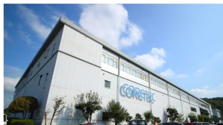
事例紹介/ コアテック(株) 社屋