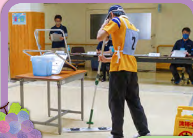
清掃 (ビルクリーニング)

障害のある方々が日ごろ培った技能を互いに競い合うことにより、その職業能力の向上を図るとともに、企業や社会一般の人々が障害者に対する理解と認識を深め、その雇用の促進と地位の向上を図ることを目的として開催します。