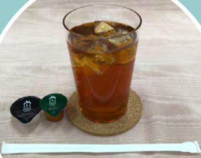
• アイスミルクティー