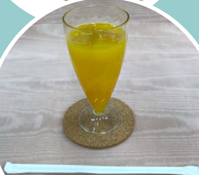
• オレンジジュース