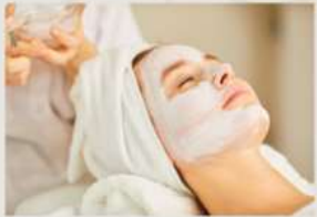
1.初心者でも基礎から学べるカリキュラム