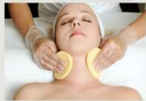
1.初心者でも基礎から学べるカリキュラム 2.即戦力・対応力・接客力が身につく