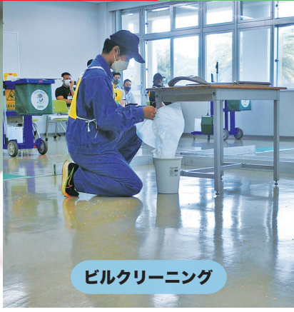
ビルクリーニング