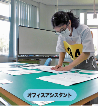
オフィスアシスタント