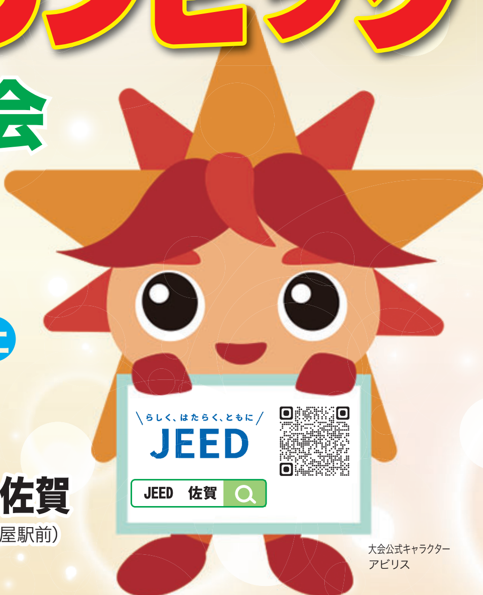
大会公式キャラクター アビリス