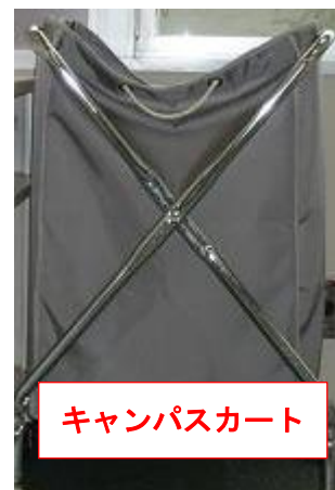
キャンパスカート