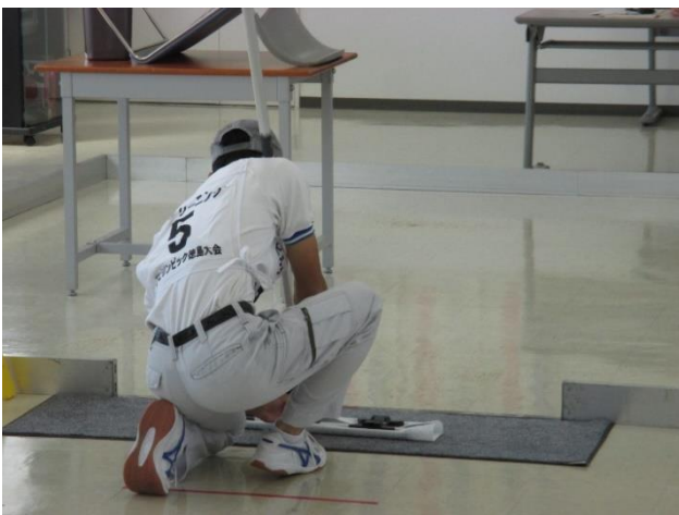
ビルクリーニング競技