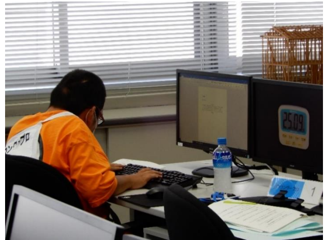
パソコンワプロ競技