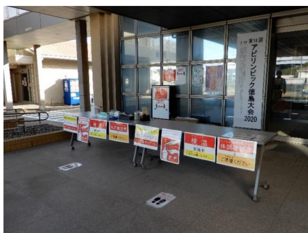
検温等を行う入場チェックブース