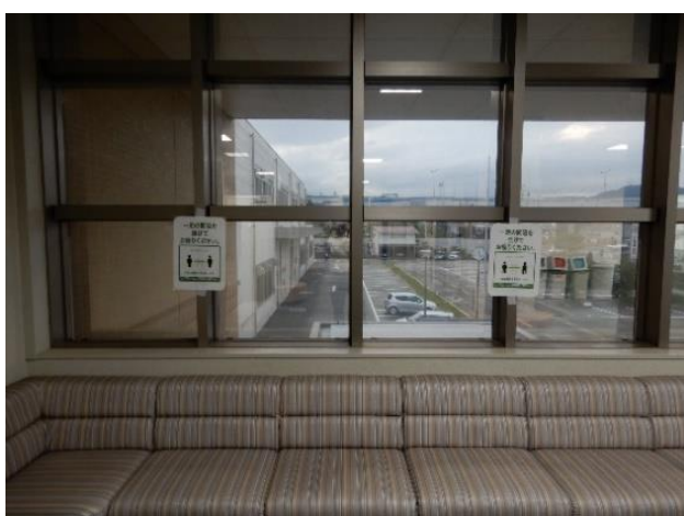
間隔を空けた着席をお願いする看板