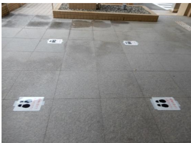
間隔を空けて整列する足跡マーク