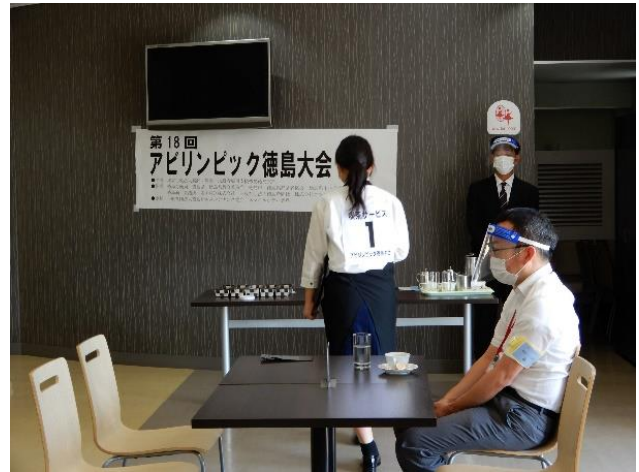
喫茶サービス競技