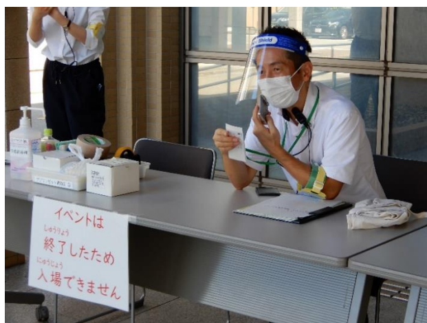
マスク・フェイスシールドの着用