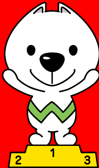
和歌山県PRキャラクター きいちゃん

今年度は、6月6日（日）に開催予定であった大会を7月11日（日）に延期し、ポリテクセンター和歌山（和歌山市園部）にて第19回 和歌山県障害者技能競技大会を開催いたしました。