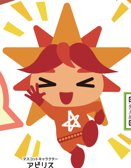
マスコットキャラクター アベリス