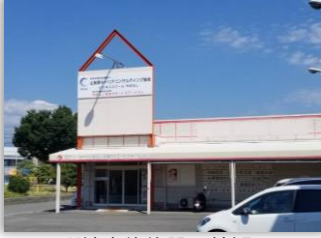
訓練実施施設 外観