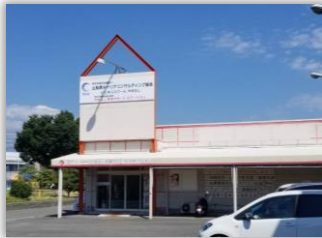
訓練実施施設 外観